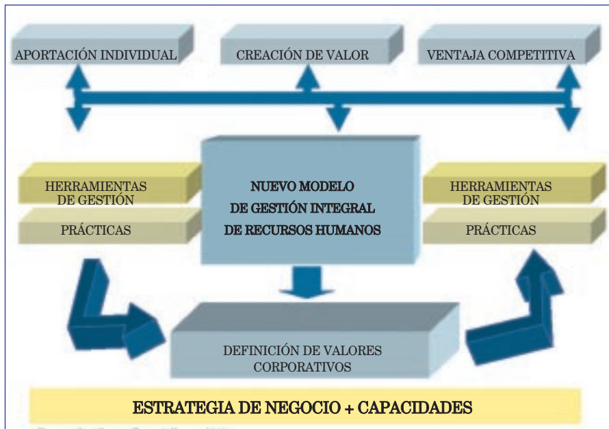
Gráfico 1. Modelo de gestión integral de RR.HH.