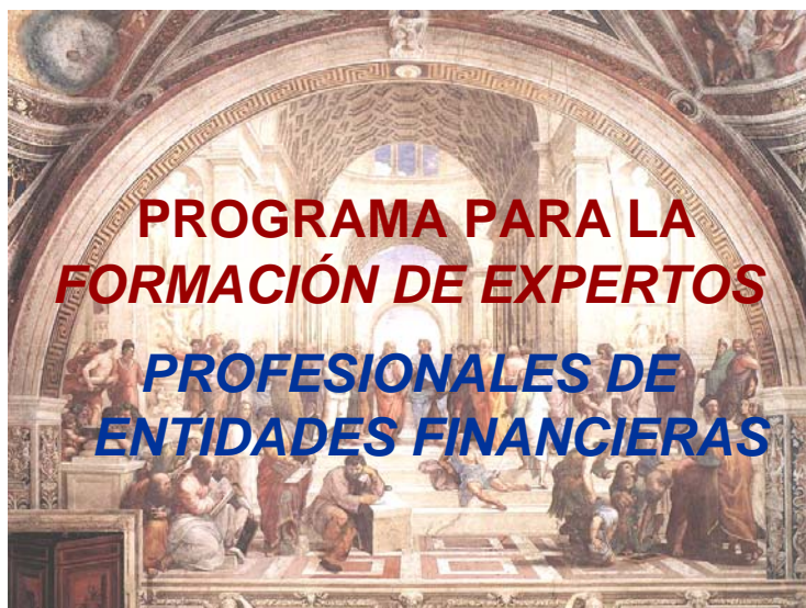
"La Academia" de Rafael, Estancias del Vaticano, S. XVI