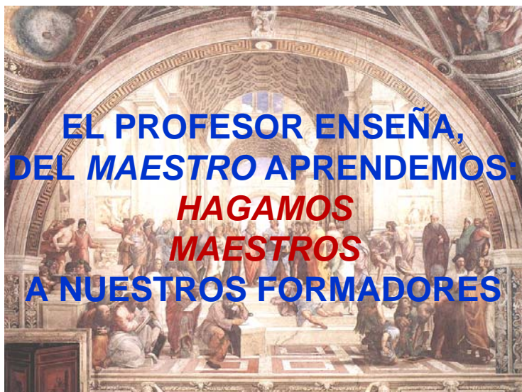
“La Academia” de Rafael, Estancias del Vaticano, S. XVI